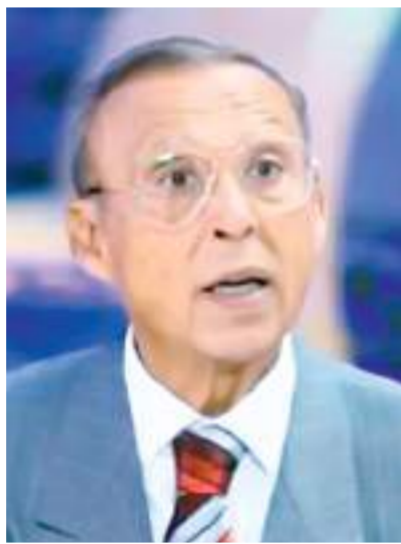
اللواء طيار أركان حرب حسن راشد