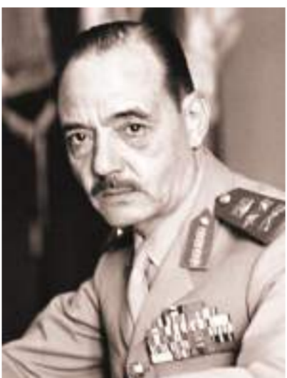
المشير محمد الجمسى

«فهمي» يعرض دور سلاح الدفاع الجوي «درع السماء»