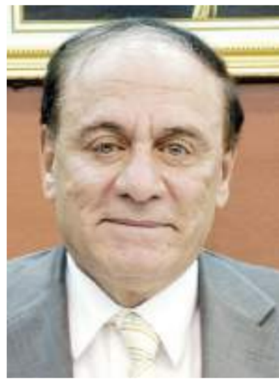
اللواء أركان حرب سمير فرج