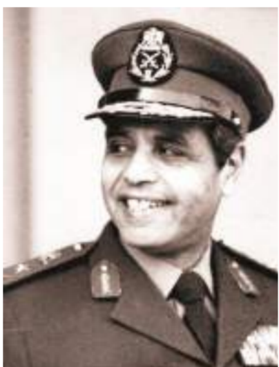
المشير محمد على فهمي

«إسماعيل» يروي تفاصيل «٣ ساعات مع حافظ الأسد» قبل الحرب