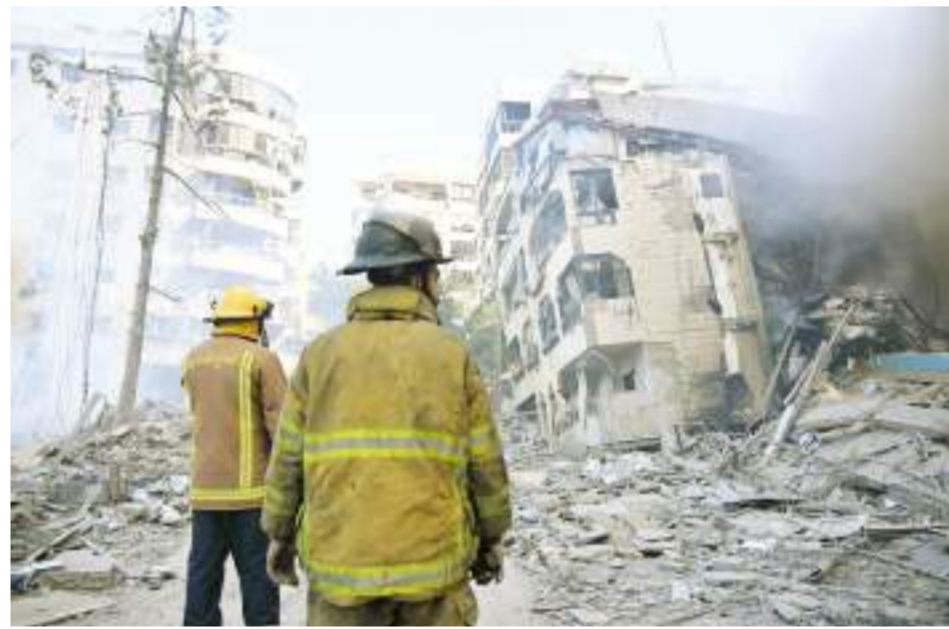
إسرائيل تواصل العدوان على لبنان

وأكد أن الإدارة الأمريكية تواصل العمل مع حكومتى إسرائيل ولبنان على أفضل مسار لاستعادة الهدوء. (طالع ص ٤)