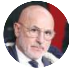
لويس دي لا فويتى

الاجل لجميع المسابرين، أوانى سيمون ورودرى ونورماند وباقي المجموعة.. وأضاف «نريد حصد الست نقاط فى هذا التوقف لضمان التأهل ثم التفكير فى الصدارة بالجولة الأخيرة فى نوفمبر».. وواصل المدرب الإسباني «منح اللاعبين راحة؟ أجرى الفيفا دراسة على مدار ١٢ عاماً الماضية لـ ٤ دورياً وكانت النسبة المثوية التى تمثلها المباريات مع المنتخب الوطنى تمثل ٢٠.٥٪ بينما النادي يمتلك للاعب لمدة ١١ شهراً»