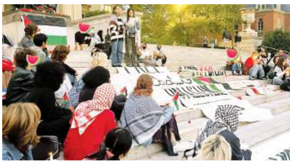
طلاب جامعة كولومبيا خلال أسبوعهم الاحتجاجى تضامناً مع غزة

نفذته حركة حماس فى ٧ أكتوبر على إسرائيل وشكل شرارة اندلاع الحرب فى قطاع غزة، قد تكون حدثاً مثيراً للاضطرابات. وكشفت استطلاع رأى من مؤسسة «إيه آر دى» الألمانية، مؤخراً، عن تزايد فى الموقف المناهض للحرب الإسرائيلىة على قطاع غزة بين الألمان، حيث أشار إلى أن ٥٧٪ من المشاركين يعتقدون أن رد إسرائيل على هجمات ٧ أكتوبر كان مبالغاً فيه. وفى سياق استمرار حراكهم التضامنى مع الشعب الفلسطينى، ورفض العدوان على قطاع غزة، بدأ طلاب جامعة كولومبيا، بولاية نيويورك الأمريكية، قراءة ٢٣٦٠ اسماً استشهادياً فى قطاع غزة خلال عدوان الاحتلال المتواصل منذ عام تكريماً لهم، وتأكيداً على أنهم ليسوا مجرد أرقام.