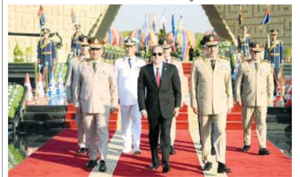
الرئيس السيسى أثناء زيارته النصب التذكارى لشهداء القوات المسلحة

السيسى ترأس اجتماع «الأعلى للقوات المسلحة» بالقيادة الاستراتيجية