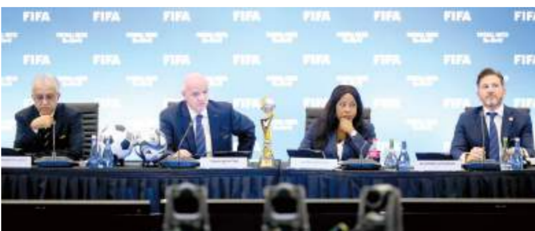
جانب من جلسات الاتحاد الدولى لكرة القدم

«تشكل بطولة كأس العالم للأندية التابعة لها) قبل انطلاق البطولة، وذلك من ١ إلى يونيو ٢٠٢٥، علماً بأن قرار فتح فترة تسجيل إضافية من عدمه يعود لكل اتحاد من الاتحادات الوطنية الأعضاء المعنية. فبعد انقضاء مهلة تقديم قوائم الفرق، إذ ستنتهى عقود بعض اللاعبين فى منتصف المنافسة، سيُسَخَّح للأندية المشاركة باستبدال اللاعبين خلال فترة المنافسة، وذلك فى غضون فترة محصورة بين ٢٧ يونيو و٢ يوليو ٢٠٢٥ وضمن حدود معينة ووفقاً لقيود محددة، من بينها ضرورة إجراء عمليات الاستبدال ذات الصلة خلال فترة مفتوحة من فترات التسجيل «العادية»، علماً بأن الهدف من ذلك هو تشجيع الأندية واللاعبين المنتهية عقودهم على إيجاد حل مناسب لتسهيل مشاركتهم فى البطولة. وفى هذا الصدد قال إنفانتينو: