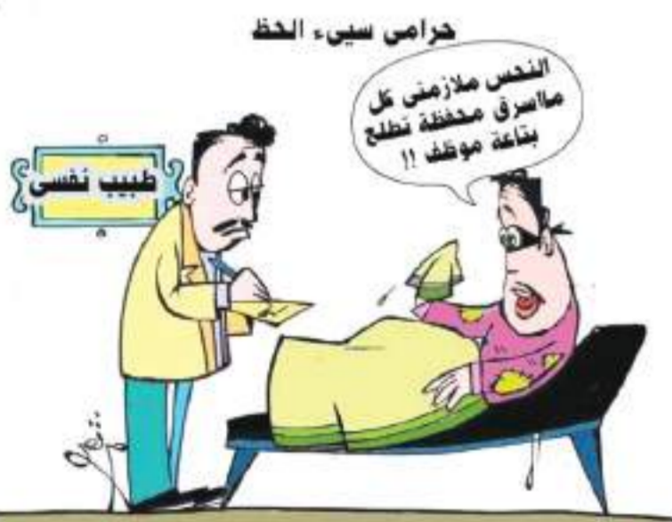
حرامى سيسى الحظ