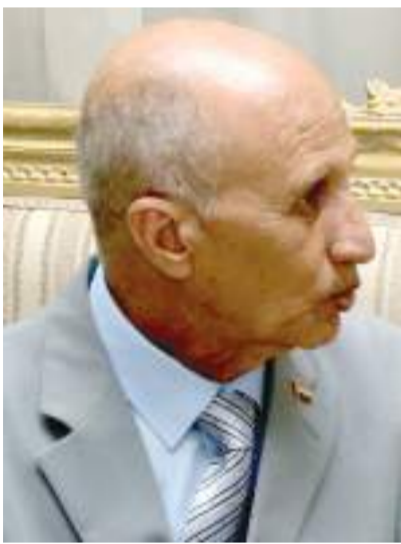
العميد هزوت زكي

«فرج»: نواجه تحديات من ٤ اتجاهات استراتيجية.. ونمتلك قيادة سياسية واعية وقادرة على حماية أرضنا