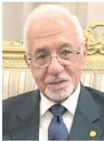
اللواء على الببلاوي