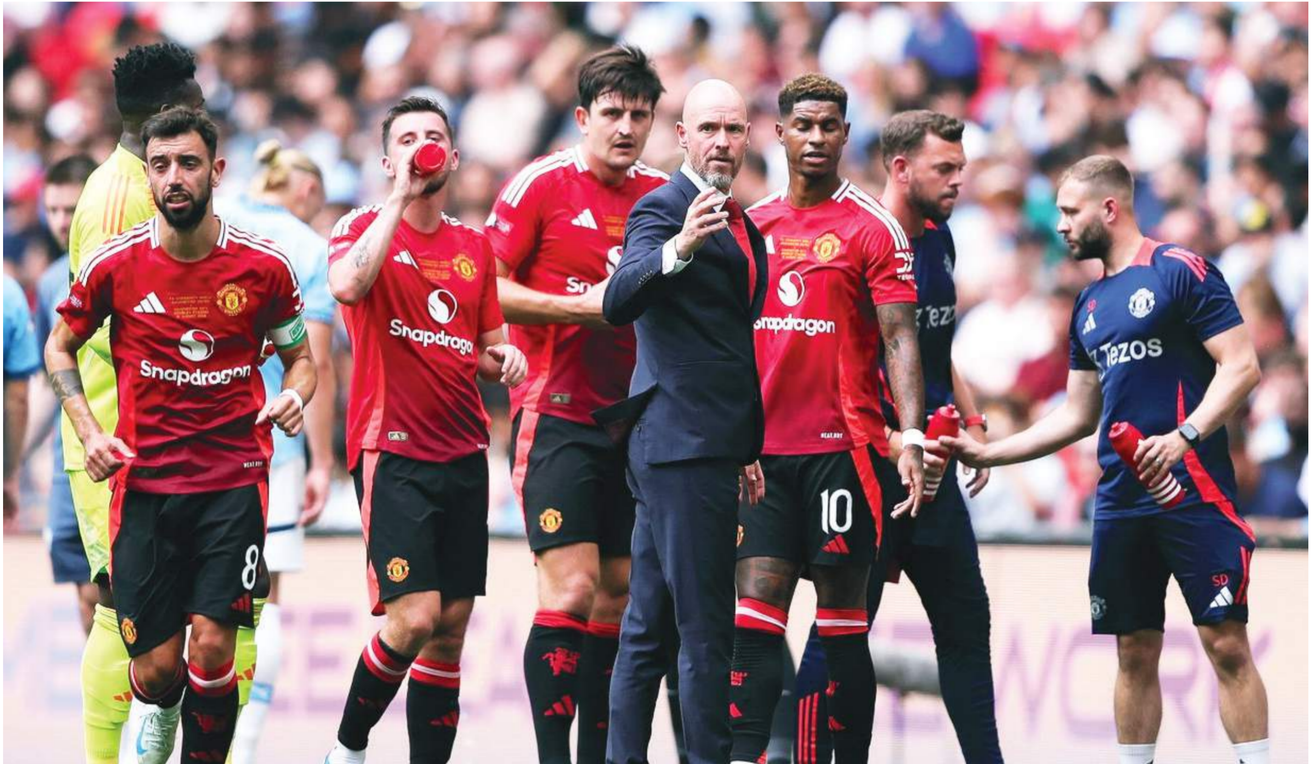
تين هاج مدرب مانشستر يونايتد يلقي التعليمات على لاعبيه

«فيلا بارك» يستضيف اليوم موقعة «مانشستر يونايتد» مع «أستون فيلا» ضمن منافسات «البريميرليج»