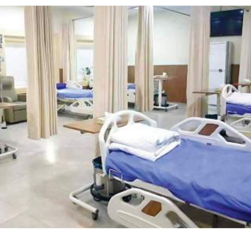
التعامل مع ١١٤٦٣ شكوى وطلبًا واستغاثة بقطاع الصحة

في إطار اهتمام القيادة السياسية بالتنوع في مد مظلة الحماية الاجتماعية لتشمل كافة الأسر الأولى بالرعاية، من خلال زيادة حزم الدعم النقدي وبرامج التأمين السكني التي توفرها الدولة؛ أهدت «الرفاعي» بيان وزراء التضامن الاجتماعي تعاملت مع ٧.٧ ألف شكوى وطلب وبلاغ خلال سبتمبر؛ حيث أنهت الوزارة إجراءات إصدار وإعادة تفعيل ٣٠٨١ كارت «كافل وكرامة» ضمن جهود الدولة لمساعدة الأسر الأكثر احتياجًا وكبار السن وذوى الاحتياجات الخاصة، كما تم توجيه ١٤٤٦ مواطنًا لتسجيل تظلماتهم بشأن النثر من عدم الاستحقاق بالبرنامج. هذا بالإضافة إلى إنهاء إجراءات ٨٤١ بطاقة خدمات متكاملة لذوي الهمم من تقدموا بشكاوى واستغايات للمنظومة، في حين تم توجيه ٧٢٨ مواطنًا لتقديم تظلماتهم للجان المختصة، كما