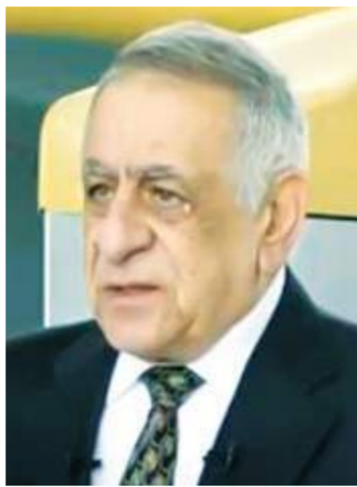
الفريق مجدى شعراوي