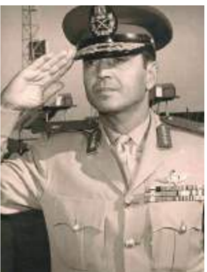
الفريق سعد الدين الشاذلي

«الجمسى» يفك شفرة الدفرسوار وكيفية التعامل معها