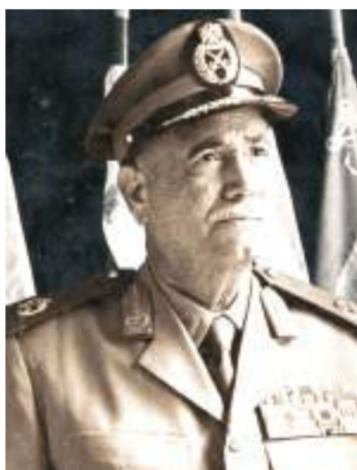
المشير أحمد إسماعيل

قوته الهجومية، على نحو ما أثبتته مواقف القتال في حرب رمضان المجيدة على جبهة القتال في يومين بارزين من سجلها القتالي. يوم الإثنين ٨ أكتوبر ١٩٧٣ عندما تحطم الهجوم المدرع للجيرال أبراهام آدان على صخرة الدفاع المضاد للدبابات على مسافة ١٠ كيلومترات شرق قناة السويس. يوم الأحد ١٤ أكتوبر ١٩٧٣ عندما تحطمت المفاز الخمس المصرية التي انطلقت بمهمة تطوير الهجوم إلى مضائق سيناء الغربية على صخرة الدفاع المضاد للدبابات وقذائف الطائرات الإسرائيلية التي وجدت في الدبابات المصرية صيدا سهلا. بعد أن خرجت عن مدى حماية غابة الصواريخ غرب القناة، ولم تكف كتائب الدفاع الجوي القليلة التي صاحبها لتوفر لها الحماية المطلوبة.